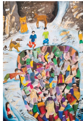
Zhen You Chen • 12 anos, Taiwan