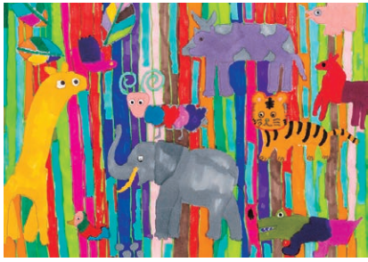
Liu Noah Mengqi 8 anos, China