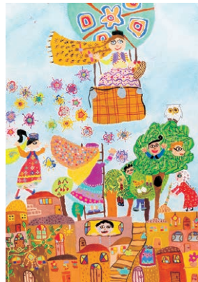
Panisa Mornmazian • 7 anos, Irão